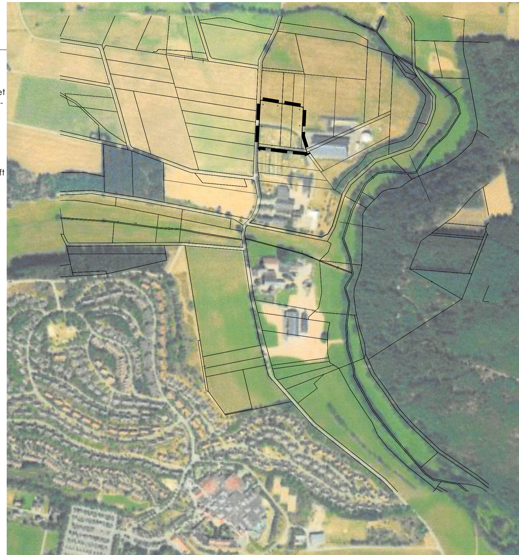
FNP Übersichtskarte mit Luftbild 1:5000