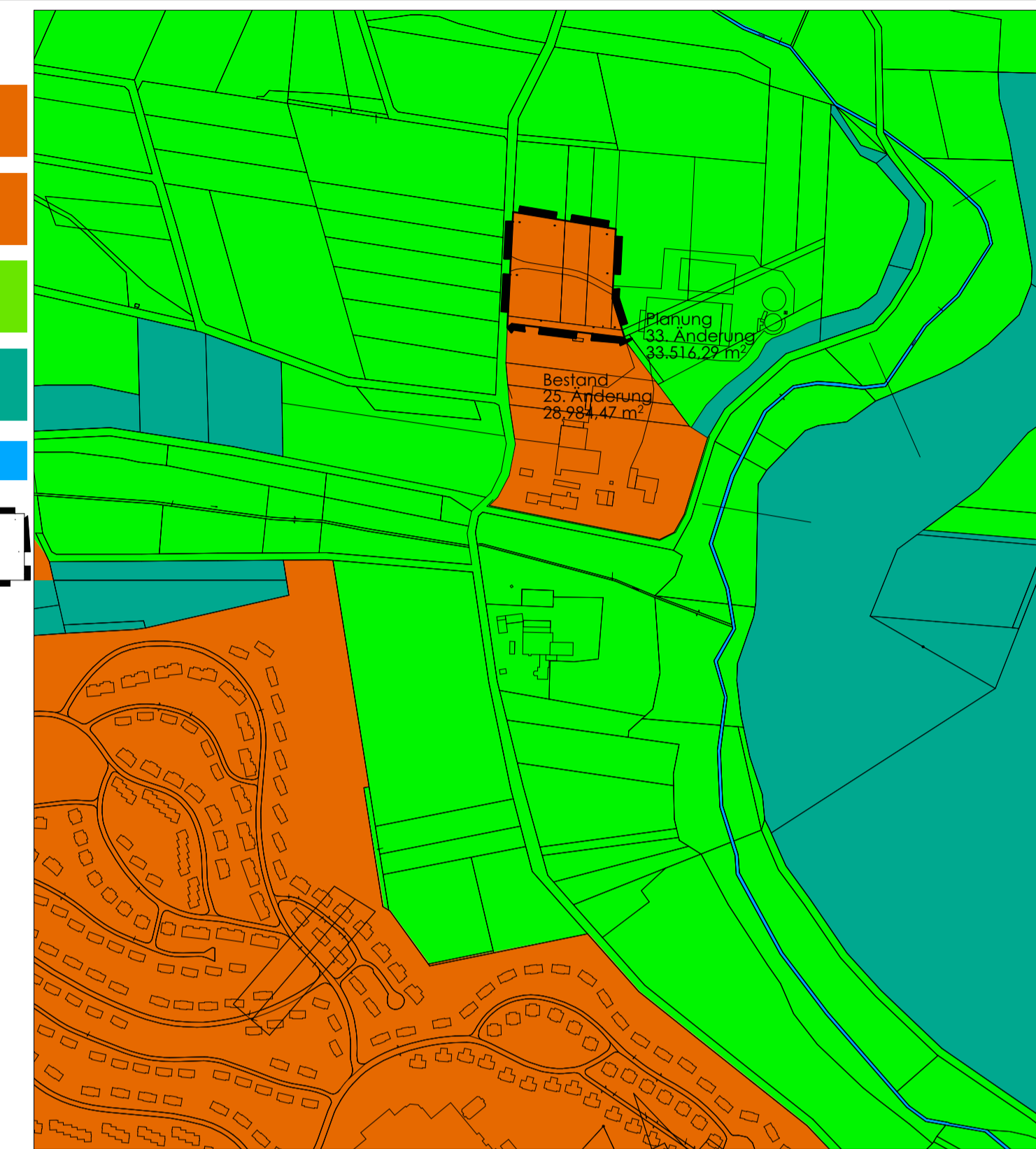
Planung Flächennutzungsplan 1:5000