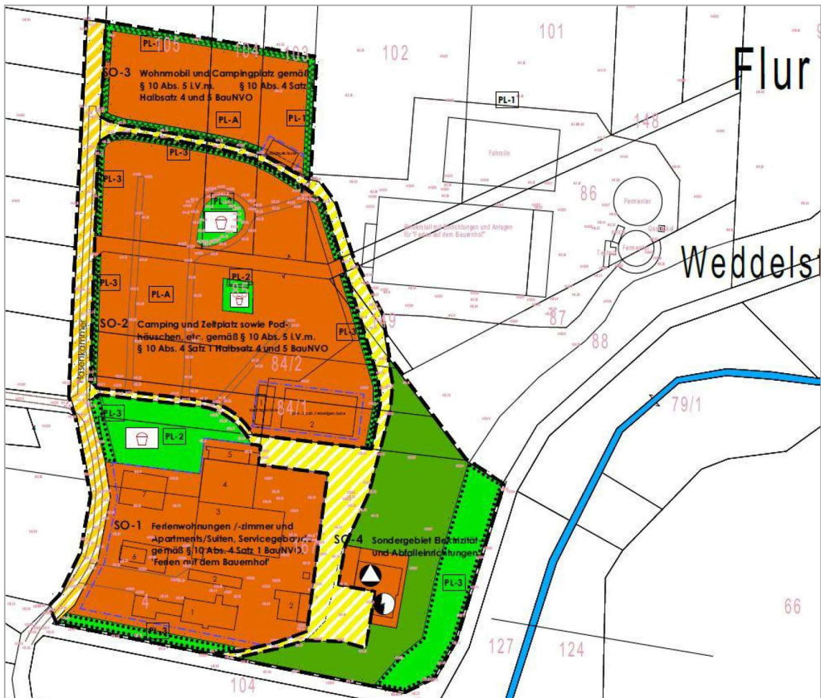
Abbildung 3: Auszug aus dem Bebauungsplan Nr. 40 (CHRISTOPHESSEARCHITEKTEN & BÜRO BÖHMER 2020b, Stand: 18.03.2020).

Im Rahmen der Umsetzung der Richtlinien 92/43 EWG (FFH-RL 1992) zur Erhaltung der natürlichen Lebensräume sowie wild lebender Tiere und Pflanzen und der Richtlinie 2009/147/EG (EG-Vogelschutzrichtlinie [V-RL]) zur Erhaltung wild lebender Vogelarten gilt es zu klären, ob es durch das Vorhaben zu Beeinträchtigungen eines Natura 2000-Gebietes und seiner Schutzziele kommen kann. Dabei sind die Auswirkungen auf die Erhaltungsziele und den Schutzzweck der ausgewiesenen Gebiete zu betrachten. Die Notwendigkeit zur Durchführung einer FFH-Verträglichkeitsprüfung (FFH-VP) bzw. Vogelschutz-Verträglichkeitsprüfung (VS-VP) ergibt sich aus §§ 34 ff. BNatSchG.