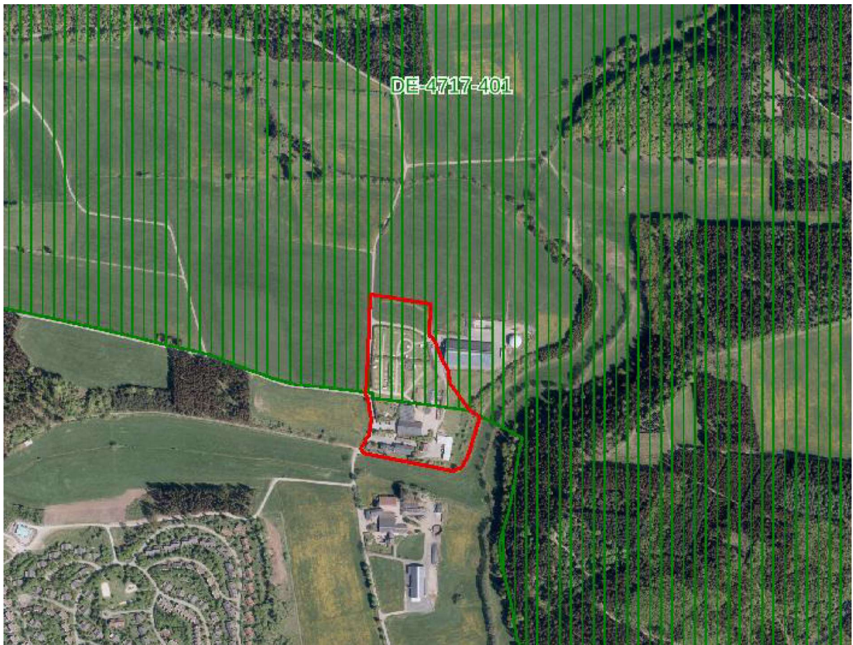
Abbildung 2: Lage des Plangebietes (rote Umrandung) im Vogelschutzgebiet „Medebacher Bucht“ (grün schraffiert) (Kartengrundlage GEOBASIS NRW 2019).