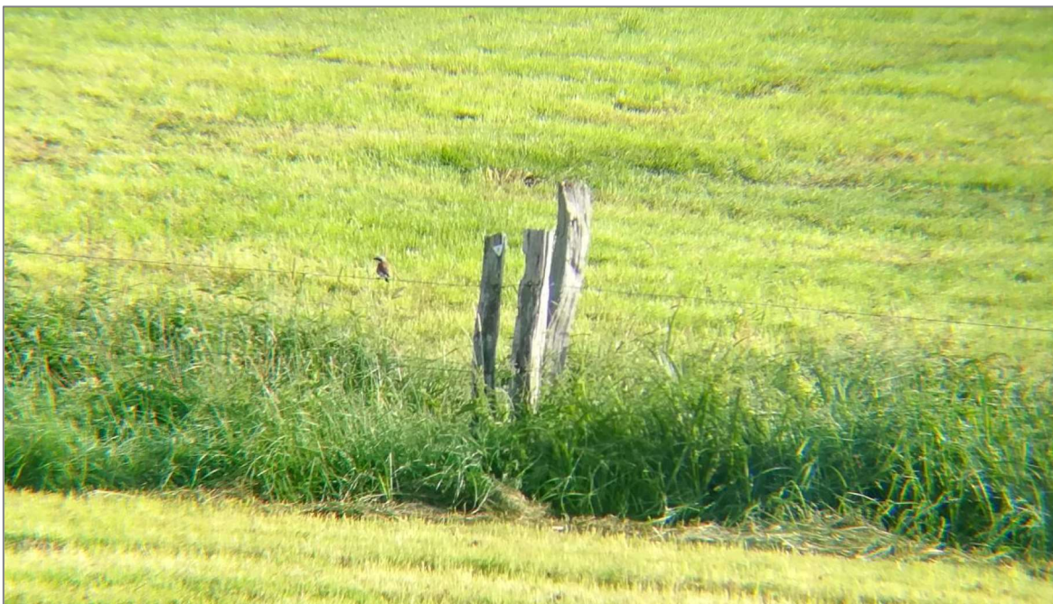
Abbildung 5: Neuntöter Männchen am Weidezaun entlang des Grabens

Der Neuntöter kommt im Vogelschutzgebiet Medebacher Bucht als Brutvogel vor. Im Untersuchungszeitraum brütete der Neuntöter ca. 400 m nordöstlich des Plangebietes. Es konnte ein Paar mit mind. zwei flüggen Jungvögeln beobachtet werden. Diese hielten sich insbesondere entlang der alten Weidezäune und der Gebüsche entlang des sich im Nordosten befindenden Grabens auf (vgl. Abbildung 5). Das Vorkommen liegt in einer Entfernung von 400 m zum Vorhaben. Direkte Beeinträchtigungen (Bautätigkeiten) können ausgeschlossen werden.